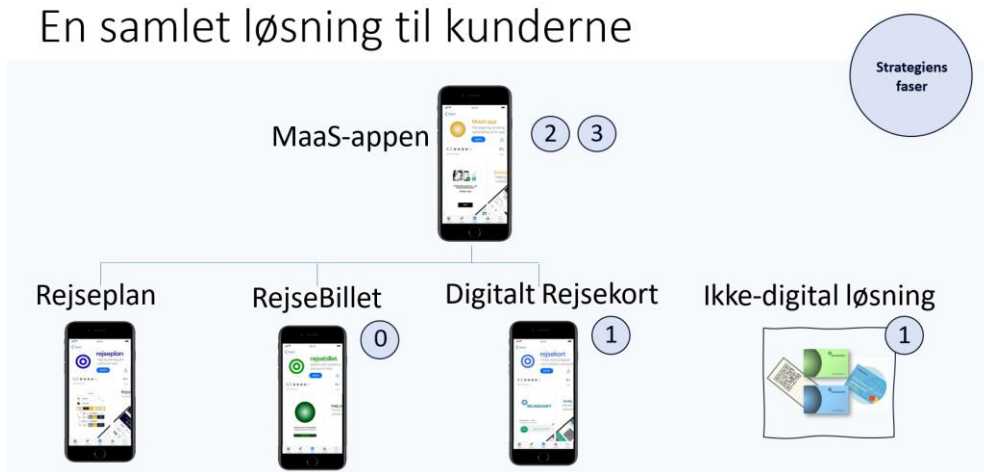
Figur 1 – Produktudviklingen de kommende år

Nedenstående figur viser produktudviklingen i de kommende år.